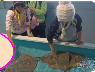
エイやサメ タコやヒトデと 直接ふれあおう