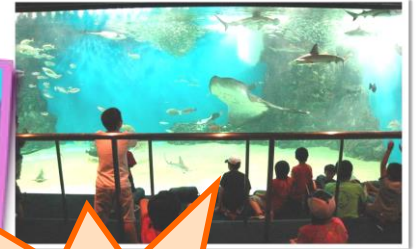
床に寝袋を並べて1泊水族館にお泊り体験するよ！