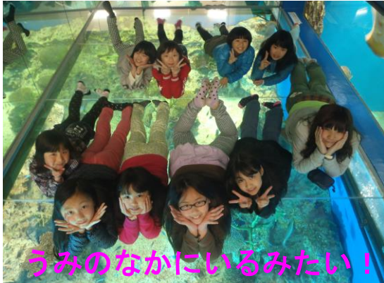
うみのなかにいるみたい！