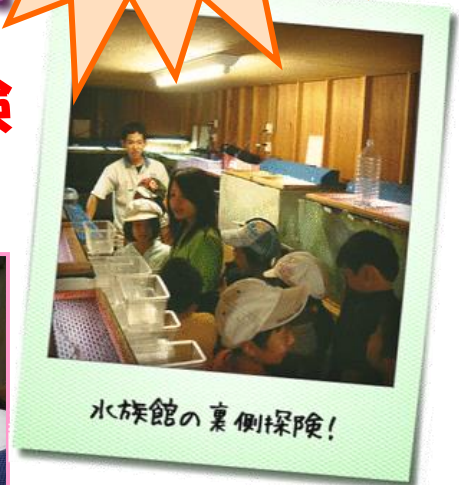
水族館の裏側探検！