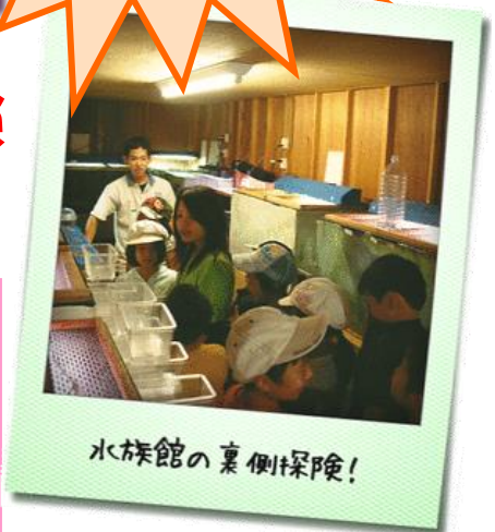
水族館の裏側探検！